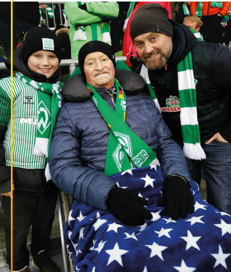
Drei wahre Werder-Fans feiern ihre Mannschaft an.