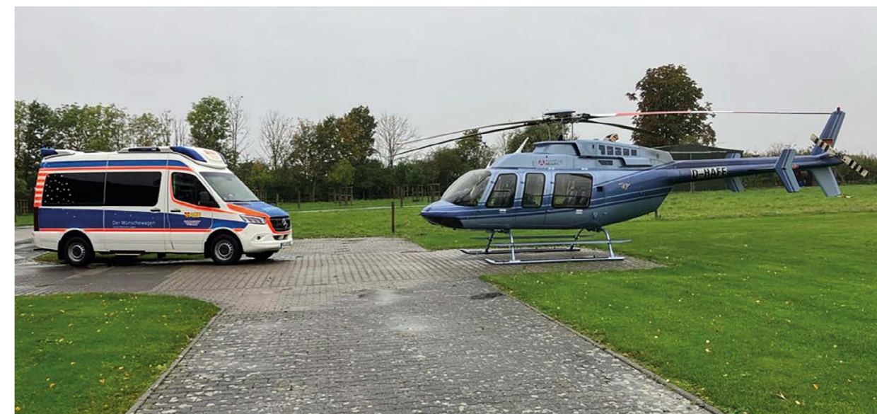
Eine außergewöhnliche Begegnung.