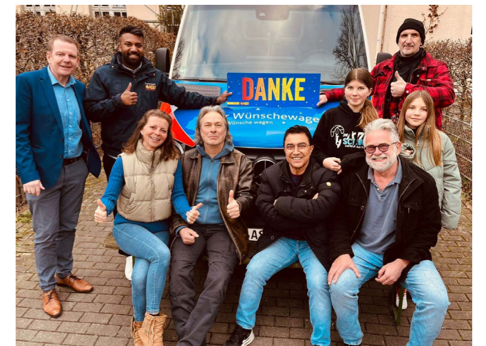
Danke für dieses wunderbare Konzert.

Das Konzert war nicht nur eine musikalische Darbietung, sondern auch eine Feier der Großzügigkeit und des Zusammenhalts. Am Ende blieben eine tiefe Dankbarkeit und Inspiration zurück. Es war ein Abend, der die Zuschauer berührte und die Welt ein Stückchen besser machte. Insgesamt kamen 800 Euro für den ASB-Wünschewagen Rhein-Ruhr zusammen.