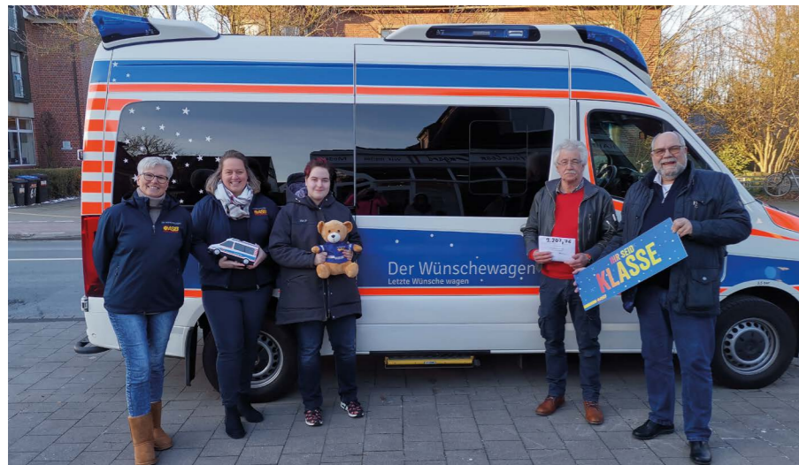
„Emmy, Du bist klasse.“

Auch 2023 haben uns wieder viele Menschen und Unternehmen unterstützt. Dafür sind wir von Herzen dankbar. Wir freuen uns über jede Spende, über jeden Geburtstagspendenaufwurf oder jede Bitte um Kondolenzspenden, über jede Benefizaktion und jedes Unternehmensengagement. Sie alle tragen aktiv dazu bei, dass wir Menschen in der letzten Lebensphase einen letzten Wunsch erfüllen können. Selbstverständlich danken wir auch allen unseren Kooperationspartner:innen in unserem großartigen Netzwerk. Sie unterstützen uns bei den Wunschfahrten ans Meer, ins Stadion oder in den Zoo und ermöglichen dadurch einen reibungslosen Ablauf und einen besonderen Tag.