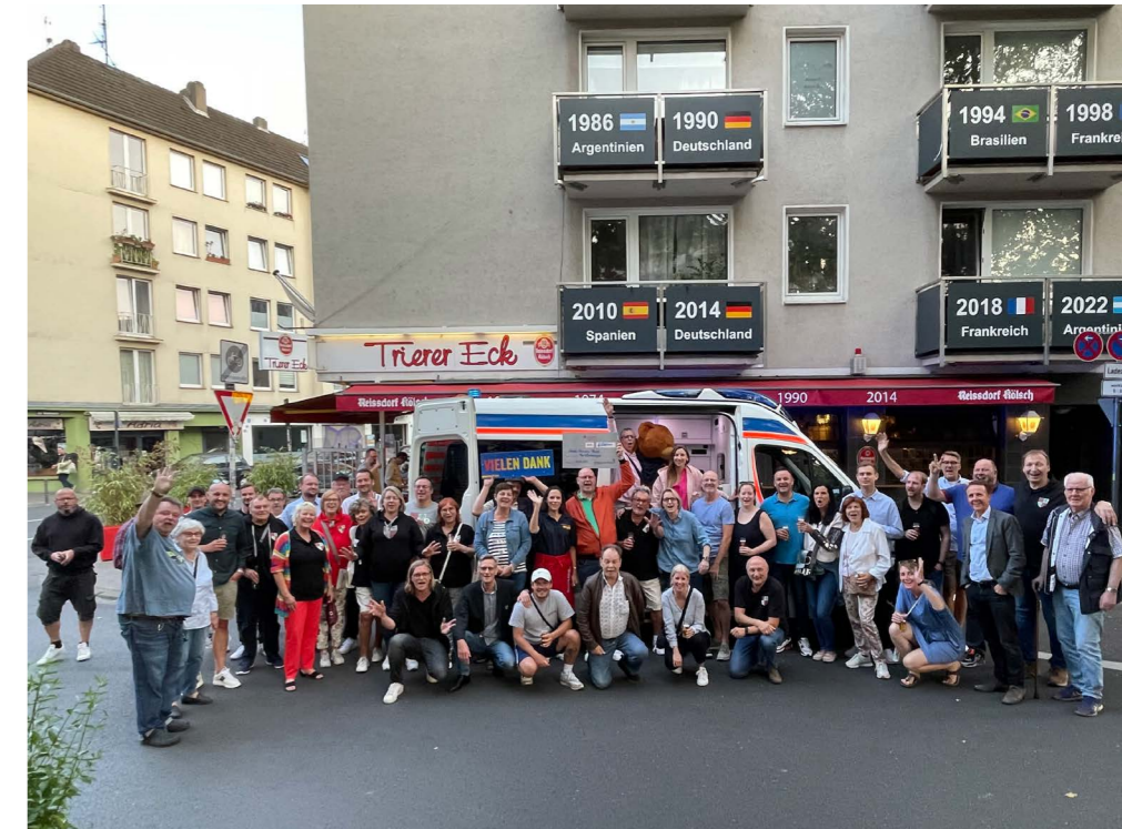
Die außergewöhnliche Spendenübergabe der Veedelsfründe.

Wir danken Euch für die großartige Aktion, für Euer Engagement, das schöne Straßenfest und die spaßige Spendenübergabe!