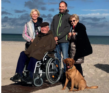
Die Familie hat den Strandspaziergang genossen.