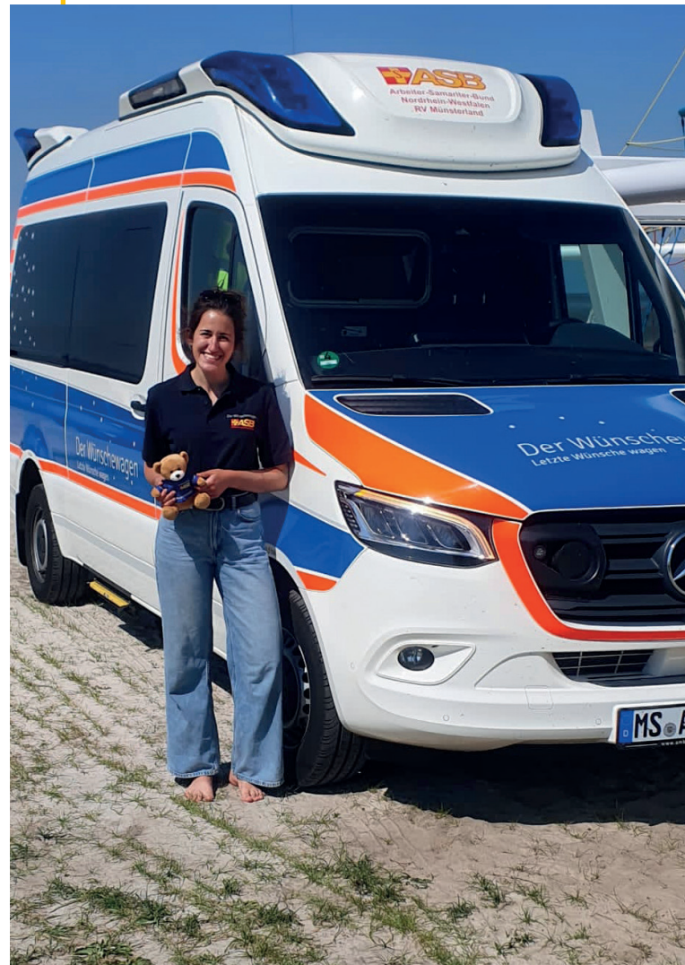
ASB-Wünschewagen Westfalen. In der letzten Phase ihres Medizinstudiums. Seit einem Jahr ehrenamtliche Wunscherfüllerin.

Für mich war das der schönste Moment auf einer Wunschfahrt, weil ich da gesehen habe, dass es manchmal die „normalen“ und „alltäglichen“ Dinge sind, die oft für selbstverständlich gehalten werden, die am sehnlichsten vermisst werden, wenn sie plötzlich nicht mehr möglich sind.