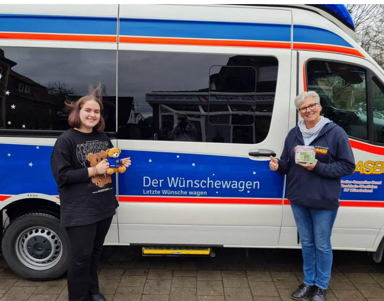
Wenn sich junge Menschen mit dem ASB-Wünschewagen identifizieren und diesen unterstützen, freuen wir uns immer ganz besonders.